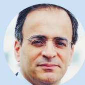
ELYÈS JOUINI, Ancien ministre du gouvernement tunisien, professeur des universités, responsable de la Chaire Dauphine-UNESCO «Femmes et science»

Stérotypes genrés et mécanismes d'autocensure qui jouent à plein et tout au long de leur scolarité chez les filles face au numérique et aux sciences, syndrome du tuyau percé dans le monde de la recherche, déperdition des talents féminins