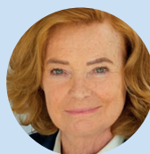
AUDE DE THUIN Fondatrice du Womens' Forum Fondatrice de Women in Africa Fondatrice de SISTEMIC

Parents, avez-vous conscience des stéréotypes genrés qui vous influencent et du rôle qu'ils vous conduisent à avoir dans les choix d'orientation genrés de vos enfants ? Maîtrisez-vous les techniques permettant de ne pas reproduire ces stéréotypes ? Avez-vous l'opportunité