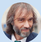
CÉDRIC VILLANI Mathématicien, médaille Fields et ancien député

Le mathématicien et Médaille Fields, Cédric Villani nous fait une promesse qui peut paraître osée mais dont il convaincra jusqu'aux