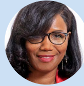
ELISABETH MORENO Dirigeante d'entreprise et ancienne ministre déléguée à l'égalité entre les femmes et les hommes, à la diversité et à l'égalité des chances

Les STEM sont de formidables leviers pour innover et impulser des transformations dans tous les domaines. À 14 ans à peine, Allyah Semiai s'en est saisie. Elle est en train de développer une solution qui est composée d'une