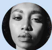
INNA MODJA Chanteuse, activiste pour le climat et les droits des femmes, et ambassadrice de la Convention des Nations Unies sur la lutte contre la désertification

Chanteuse, actrice et ancien mannequin, activiste pour le climat et les droits des femmes, l'artiste et ambassadrice de la Convention des Nations Unies sur la lutte contre la désertification, Inna Modja s'est engagée dans le Web3 et les NFT en bouleversant les modèles traditionnels de collectes