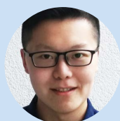
JIALIN LIU Compositeur