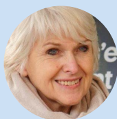
ISABELLE ROME Ministre déléguée auprès de la Première ministre chargée de l'Égalité entre les femmes et les hommes, de la Diversité et de l'Égalité des chances