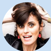
SANDRINE SARROCHE Humoriste, performeuse de one-woman-shows, chroniqueuse à la radio, à la télévision, chansonnière et actrice française

Sandrine Sarroche manipule une arme incroyable : celle de l'humour !